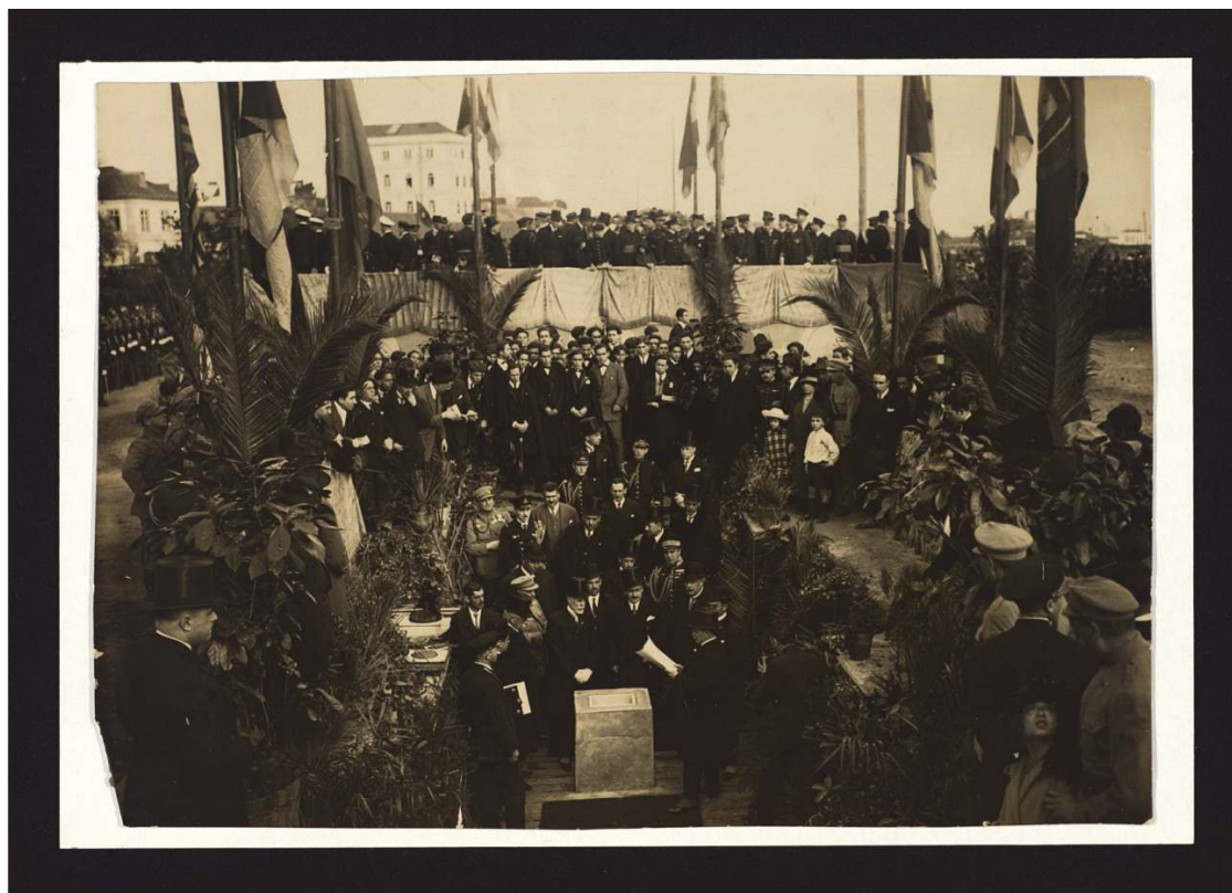
Homenagem a Vasco da Gama em Lisboa com o presidente da República Manuel Teixeira Gomes: leitura do auto.

O médico propôs que se edificasse um monumento comemorativo em honra do navegador com o auxílio da Presidência da República, do Governo e das restantes câmaras municipais do