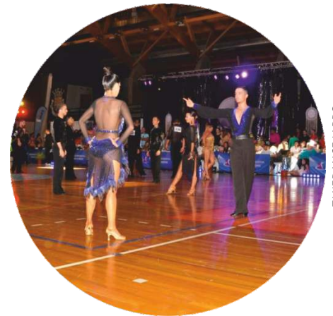
TAKEDANCE / ARDS

A Associação Recreativa de Dança Sineense promoveu no dia 21 de julho, no Pavilhão Multiusos, a XIX edição do seu Festival Alentejo, o maior festival de danças de salão e latino-americanas da região e um dos maiores de Portugal.