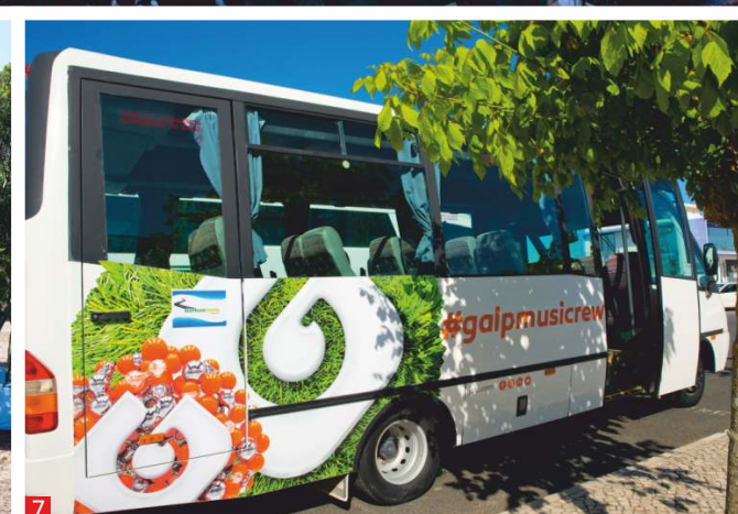
[1] O núcleo de Porto Covo registou crescimento de público. [2] Sara Tavares deu um dos grandes concertos desta edição. [3] A edição comemorativa dos 20 anos mereceu um espetáculo de fogo de artifício na baía. [4] Os concertos da tarde no Castelo foram muito concorridos. [5] Melhor ambiente e menos desperdício. Foram esses os objetivos do copo reutilizável do FMM Sines 2018. [6] Foi criada uma nova área de acampamento alternativo, com melhores condições para os campistas, na zona poente da cidade. [7] O "shuttle" FMM Sines 2018 garantiu a ligação entre Sines e Porto Covo nos dias do festival.