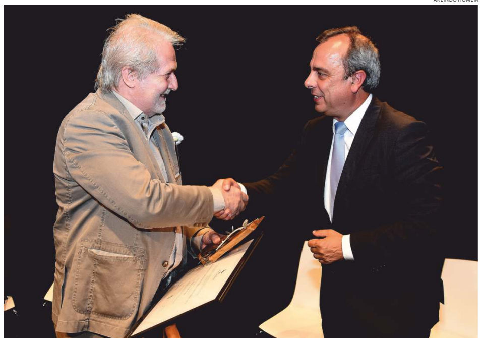
O compositor húngaro Péter Eötvös, à esquerda, foi um dos premiados

O auditório do Centro de Artes de Sines acolheu, a 7 de julho, a entrega do Prémio Internacional Terras Sem Sombra 2018. O compositor húngaro Péter Eötvös (na música), a cidade espanhola de Albarracín (na valorização do património cultural) e a Associação Portuguesa para a Diversidade da Videira – PORVID (na salvaguarda da biodiversidade) foram os distinguidos na cerimónia, que contou com a presença do ministro do Ambiente, João Pedro de Matos Fernandes. O Festival Terras sem Sombra é organizado pela Associação Pedra Angular e tem o apoio da Câmara Municipal de Sines, entre outras entidades.