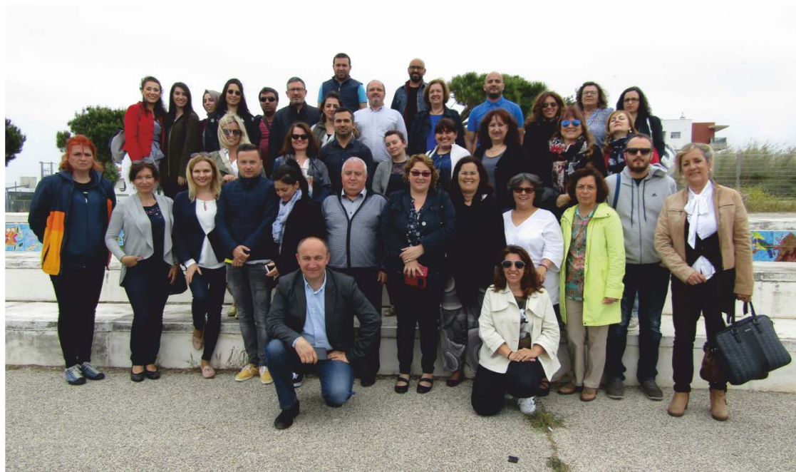
Visita dos parceiros europeus do projeto a Sines

O Agrupamento de Escolas de Sines está envolvido num projeto europeu focado nos alunos com problemas de dislexia.