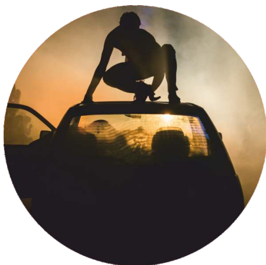
HANNO 29 SET | 22h45 Largo 5 de Outubro

00h15 / Início no Largo João de Deus, seguido de percurso no centro histórico / 50' SU À FEU // Percussão / dança urbana / fogo, pela comp.ª Deabru Beltzak (ES)