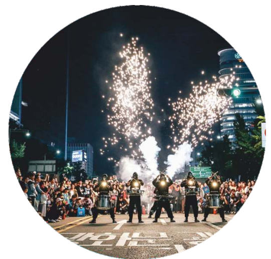
SU À FEU 29 SET | 00h15 Início no Largo João de Deus seguido de percurso no centro histórico

Dois personagens são atraídos para um mundo de BD e filmes de animação através de vídeos projetados em grande escala. Fazem uma viagem entre a natureza dos desenhos animados e a pseudo-realidade de um ecrã de computador. Pela companhia italiana eVenti Verticali.