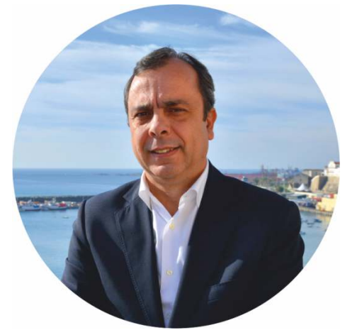
Nuno Mascarenhas Presidente da Câmara Municipal de Sines

Publicamos esta edição do boletim municipal no final do verão, fazendo o balanço dos grandes eventos, fatores de atração de visitantes a Sines e Porto Covo.